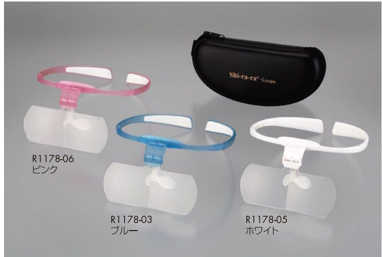
※焦点距離: 1.6倍は約25~35cm、2.0倍は約20~30cmが目安となります。(個人差があります)

広視野で周辺部の歪みの少ない特殊形状レンズを、人間工学に基づき設計されたフィット感の良いTR-90(形状記憶樹脂)製のフレームに装着。用途に応じてレンズアングルが調整でき、日常使用はもちろん、医療・研究・検査の現場でもご活用いただけます。