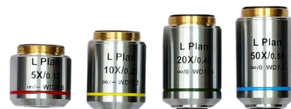
※100倍率の商品画像は未掲載です。