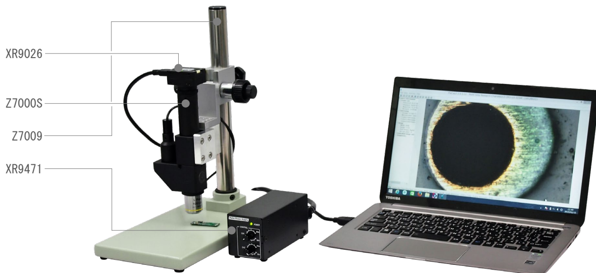
* 上記写真のカメラはXR9026